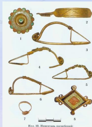
Илл. 10. Инвентарь погребений: